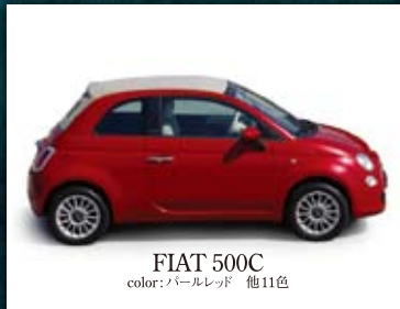
FIAT 500C color: パールレッド 他11色