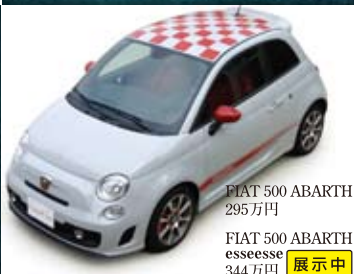
FIAT 500 ABARTH 295万円 FIAT 500 ABARTH esseesse 344万円 展示中