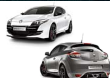
RENAULT MEGANE RS