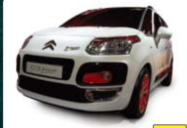
CITROEN C3 Picasso 278万円 展示中

これからの「クルマ」の楽しみ方は、 記憶に残る時間を 共有すべき相手、「クルマ」と 過ごす事