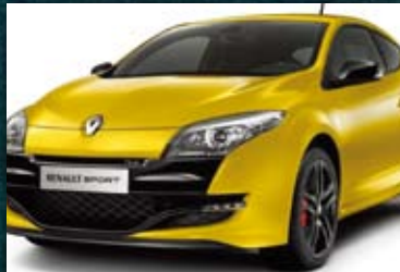
RENAULT MEGANE RS