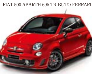
FIAT 500 ABARTH 695 TRIBUTO FERRARI