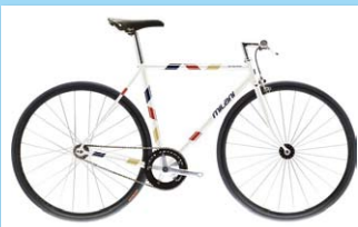
VIA SOLFERINO 販売価格 172,000円