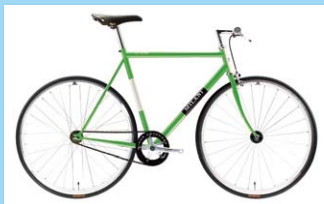
VIA TORTONA 販売価格 167,000円