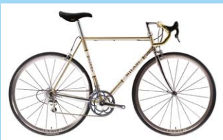
REPLICA 販売価格 510,000円

1927年から続くイタリアの自転車老舗メーカー「MILANI」。 全モデルが顧客からのオーダーを受けてからの生産となり、その生産の全てをイタリアで行います。 数名の職人スタッフにより手作業で仕上げられる特別な一台をLussoCarsがお届け致します。